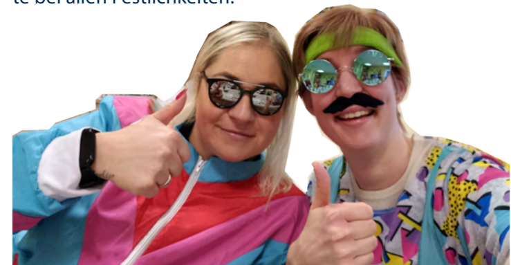
2 jecke Kolleginnen

Auch an allen anderen Kölner Standorten und in Leverkusen wurde gefeiert, sei es beim Karnevalsfrühstück in Köln-Chorweiler an Weiberfastnacht, bei der Karnevalsfeier im Paulinum Altstadtstraße in Leverkusen am Karnevalsfreitag oder bei der Rosenmontagsfeier im Paulinum »Am Zoo« – eine großartige Stimmung herrschte bei allen Festlichkeiten!