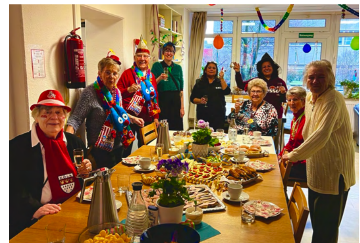
Weiberfastnacht in Köln-Chorweiler