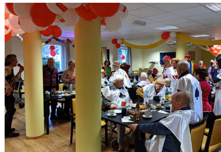
Haussitzung im Paulinum WesthovenPark